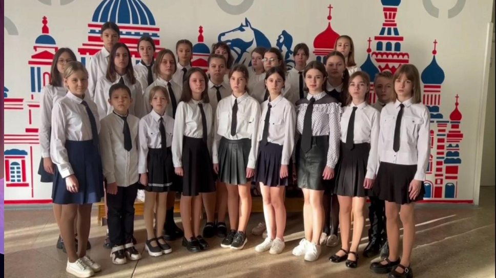
Хор школы №8 г. Снежное

Школьный конкурс-фестиваль патриотической песни «Битва хоров»