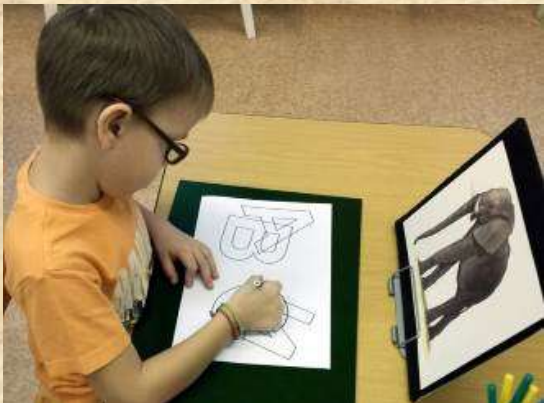
Рис.2 Использование подставок и фонов