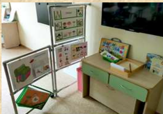
Рис.3 Речевой центр группы для детей с нарушениями зрения

Внедрение интерактивных коммуникативных технологий («Работа в парах» (Рис.4), «Хоровод», «Карусель» (Рис.5), «Аквариум», «Дерево знаний», «Цепочка», «Интервью» и др.) активизирует процесс общения ребенка-дошкольника с окружающими его взрослыми и сверстниками, формирует речь, развивает игровую и познавательно-исследовательскую деятельность.