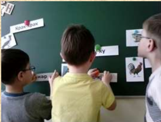
Рис.1 Работа у доски