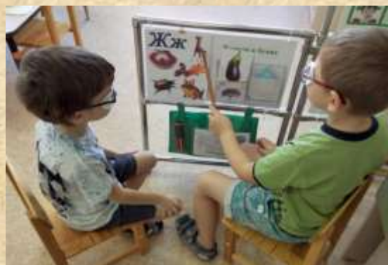
Рис.4 Работа в паре