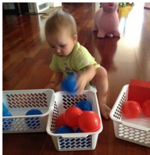
Игра «Делай как я!»

Предложите ребенку собрать кубики, шарики (или любые другие предметы) по цветам, форме, размеру.